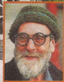
Der österreichische Künstler Friedensreich Hundertwasser (†) gestaltete das Café.